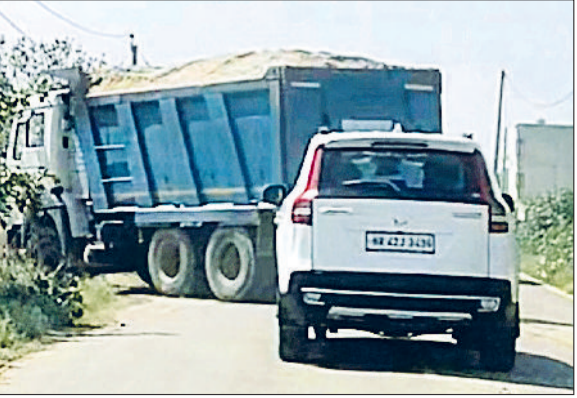
गन्नौर। बगैर तिरपाल ढके सड़क पर दौड़ रहे मिट्टी के ओवरलोड डंपर।

मिट्टी से भरे ओवरलोडिंग डंपरों से उड़ती धूल से लोग परेशान हैं। खुले में मिट्टी ढो रहे भारी वाहन दोपहिया वाहन चालकों, दुकानदारों और पैदल राहगीरों के लिए खतरा बने हुए हैं। हालात यह हैं कि प्रशासन की नाक के नीचे से ये ओवरलोडिंग डंपर धड़ल्ले से गुजर रहे हैं, लेकिन कार्रवाई के नाम पर जिम्मेदार