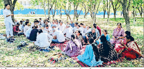
सोनीपत। विरोध प्रदर्शन करते यूनियन के पदाधिकारी एवं सदस्यगण।