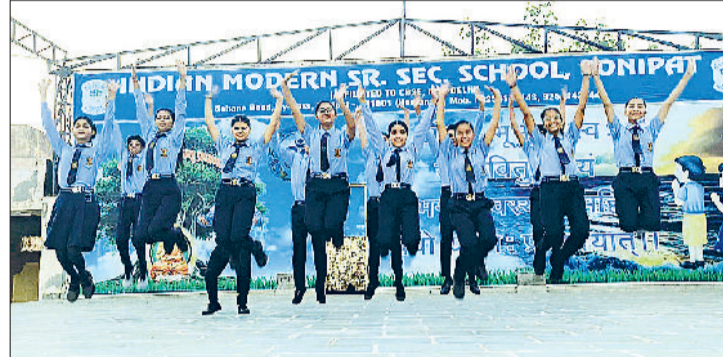
सोनीपत। इंडियन मॉडर्न पब्लिक स्कूल में परीक्षा परिणाम पर छात्रों ने ऐसे मनाई खुशी।