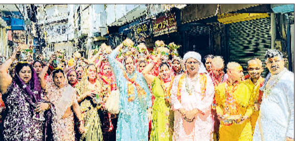
सोनीपत। बड़ा बाजार में निकाली कलश यात्रा में शामिल श्रद्धालु।